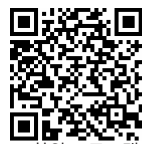
학위 프로그램 정보

을(를) 참고하기 바랍니다. USC 인터내셔널 아카데미 합격증에 예비 석사 프로그램 필수 학업 기간과 석사과정 시작일에 근거한 자세한 학업 계획이 안내되어 있습니다.